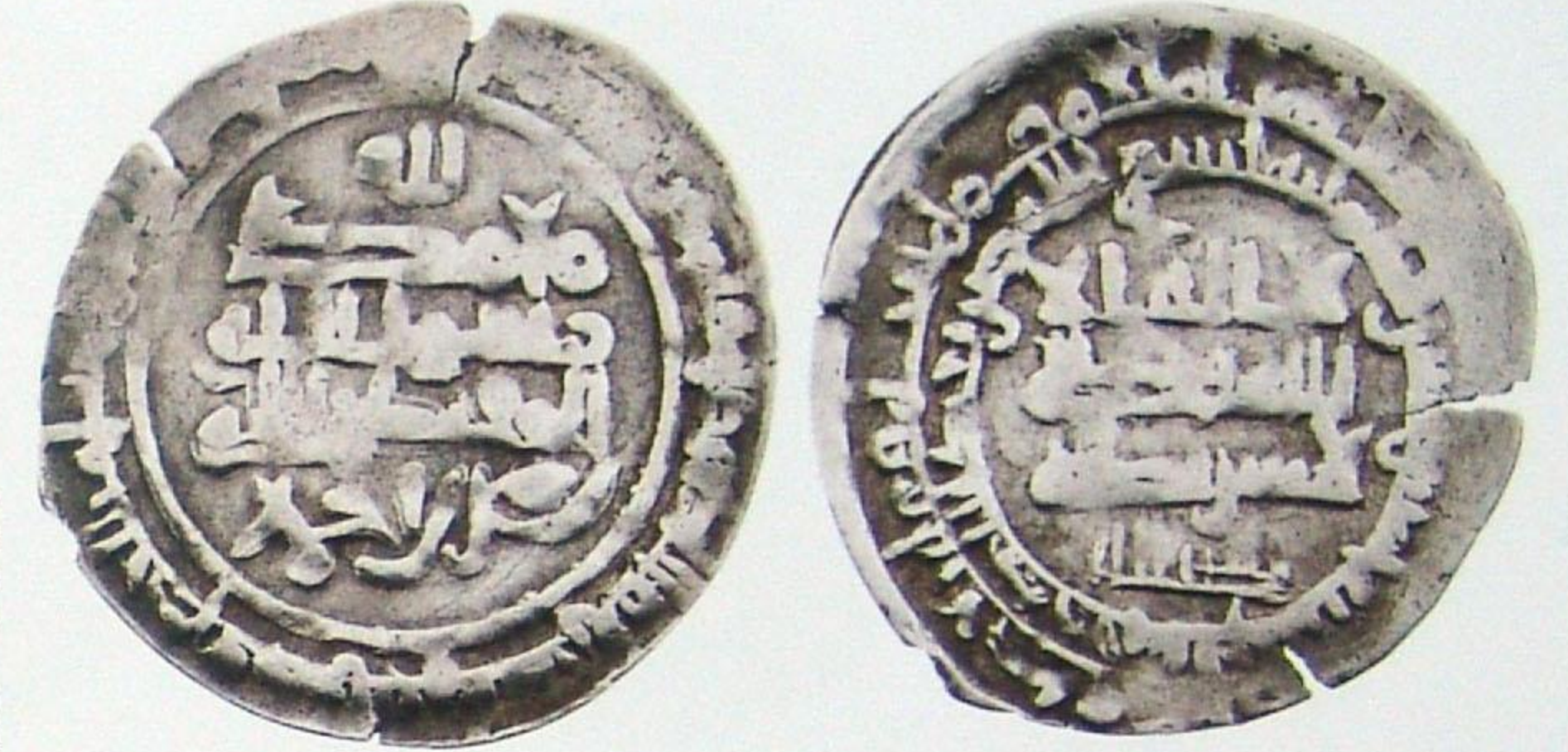
درهم ساماني نصر بن أحمد ضرب: بلخ سنة: ٣١٥ هجري

The Bowaihi state was contemporary to the Abbaside state and usurped the authority of the Abbaside Khalifas. Nevertheless, the Bowaihi coins were minted along lines identical to those of the Abbasides, featuring the names of their rulers on both the front and reverse sides of the coin, along with the name of the Abbaside Khalifah.